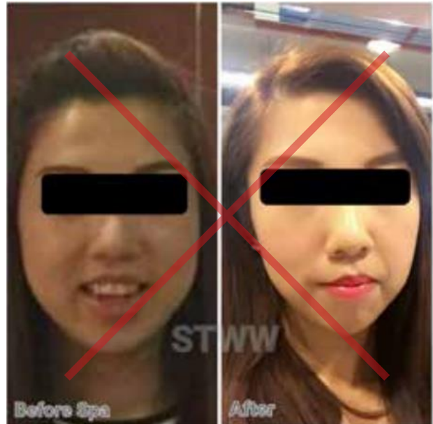
La coherencia no se ha respetado. La iluminación, el maquillaje y el ángulo son diferentes.