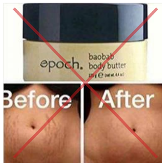
Se muestran reclamos de productos no autorizados.