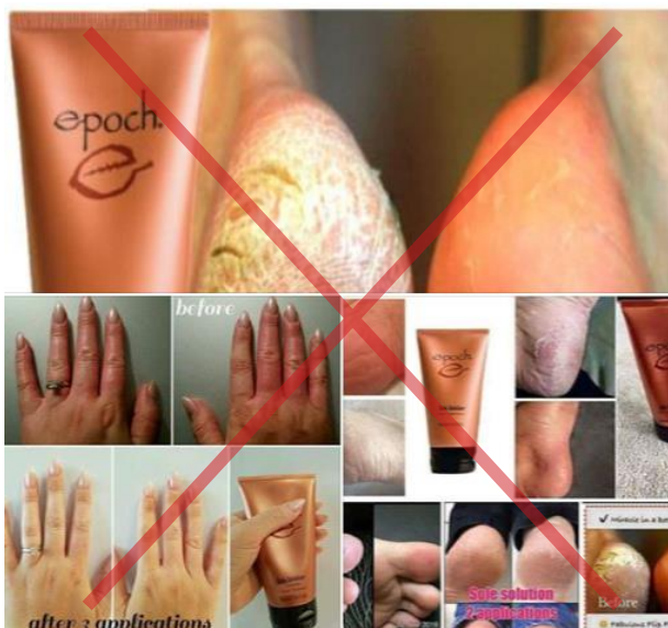
Se muestran reclamos de productos no autorizados.